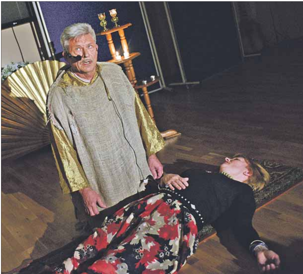
Евгений БЕЛОВ в мюзикле «Нотр-Дам де Пари»