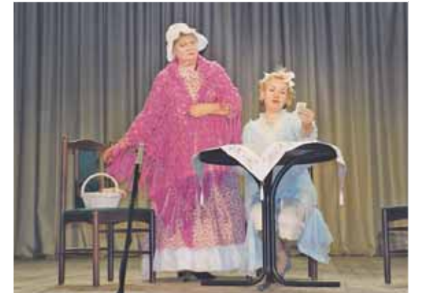
Во время спектакля не чувствуется возраста и усталости актеров

Режиссер рассказывает: «На это представление пришел мой старый друг, актер, и прочитал такие стихи: «Дела и обстоятельства, но годы – не помеха, вы все, вы все талантливы, желаем вам успеха!» Мы выступаем в различных ТЦСО. Теперь театральные студии будут работать в рамках проекта «Московское долголетие». Я надеюсь, что это поможет нам развиваться, покупать костюмы, декорации, у нас наконец будет постоянное помещение для репетиций».